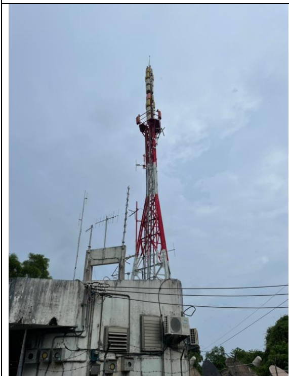
南澳轉播站外塔台