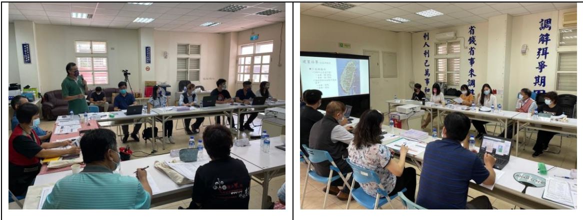
聽取原文會工程簡報