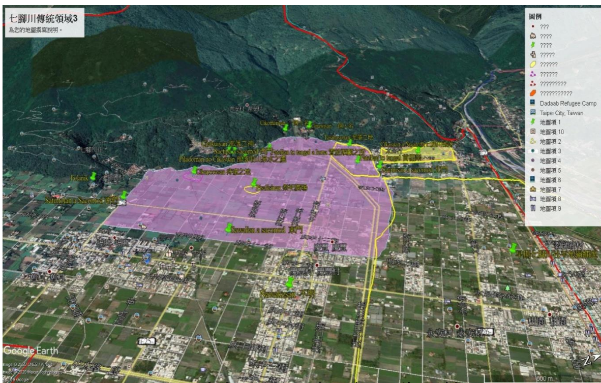
七腳川部落傳統領域示意圖(新、舊部落)