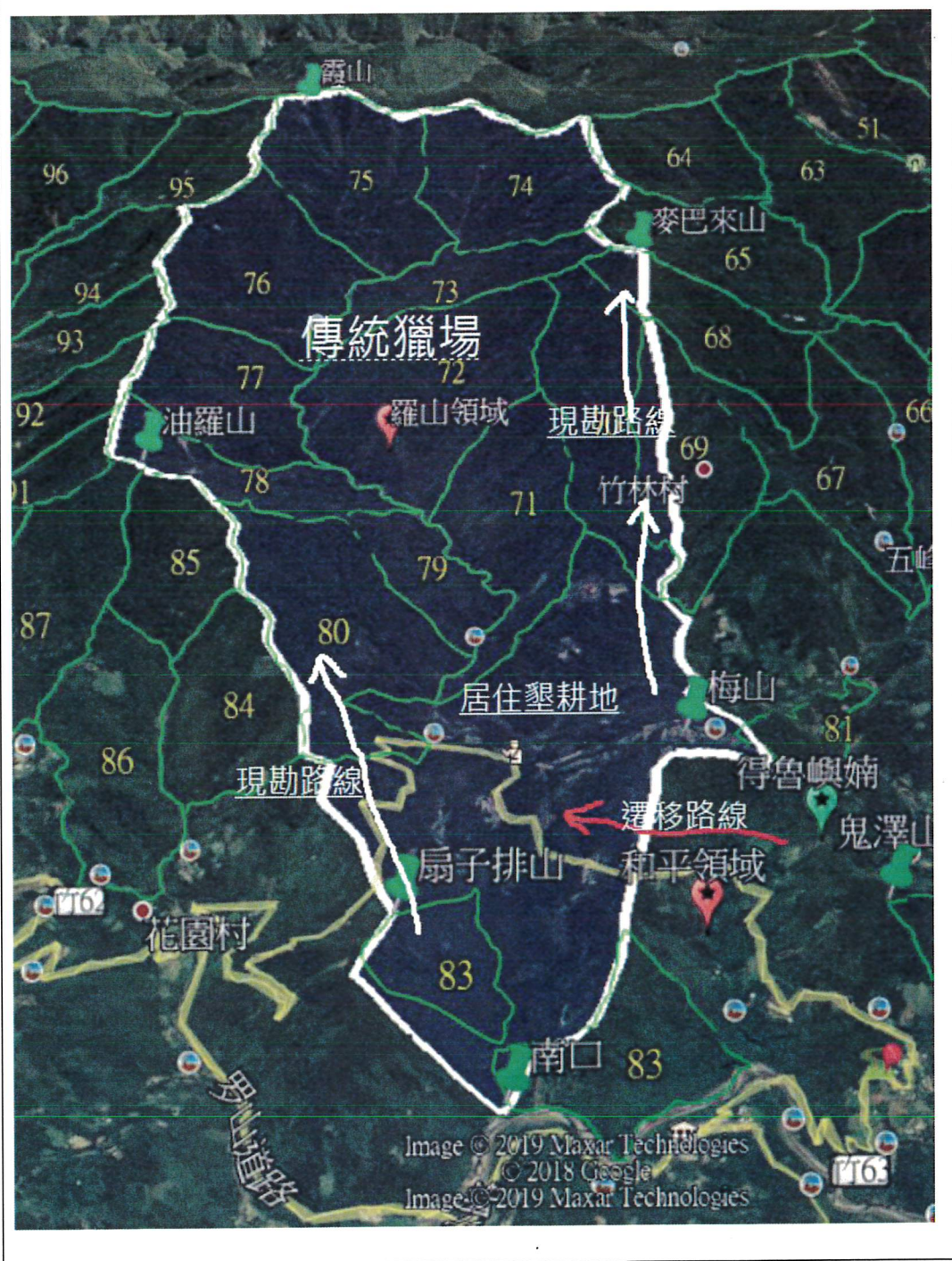
和平、羅山、忠興、茅圃民族傳統領域土地調查路線圖