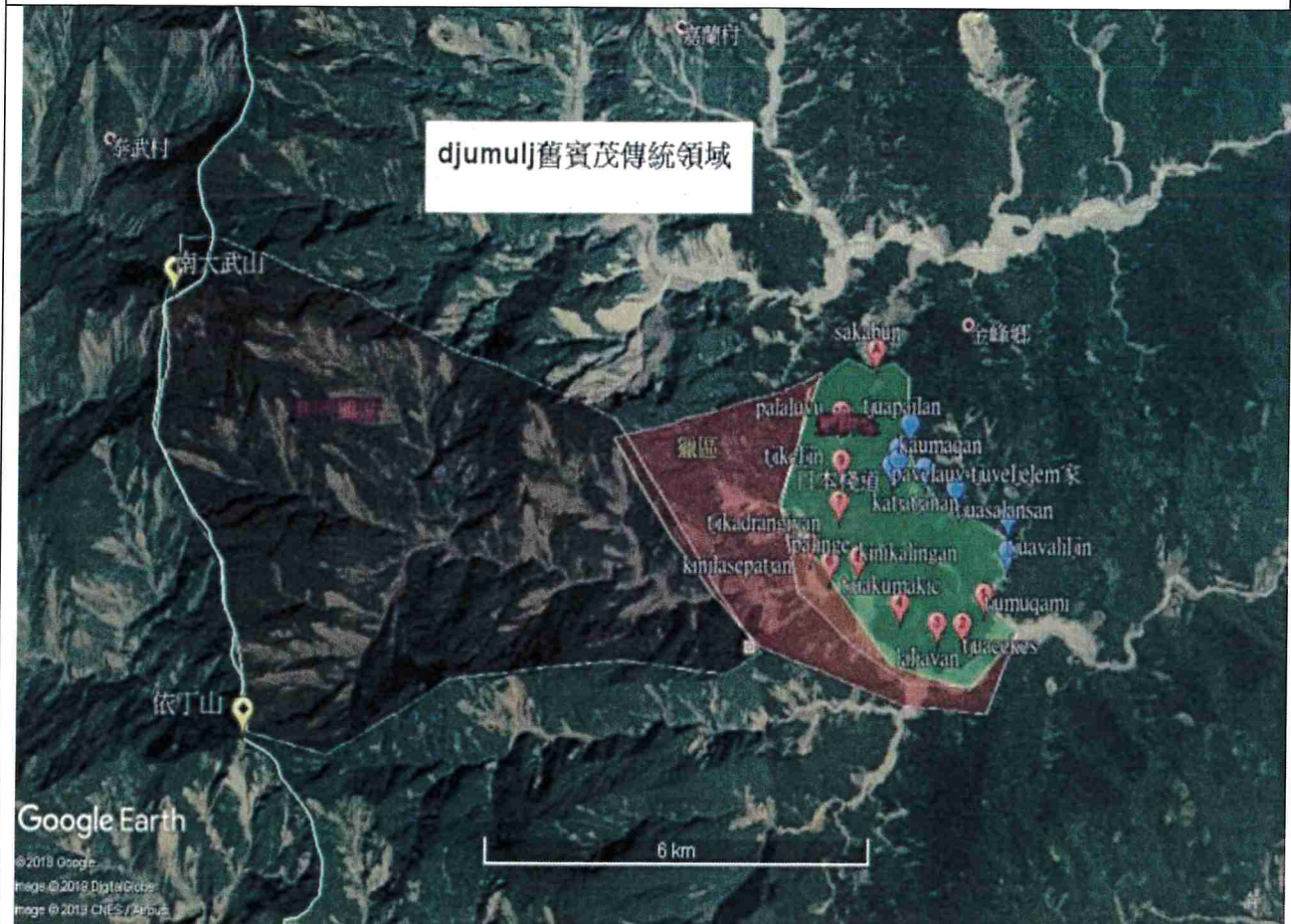
■_ djumulj(賓茂)_部落民族傳統領域土地調查路線圖