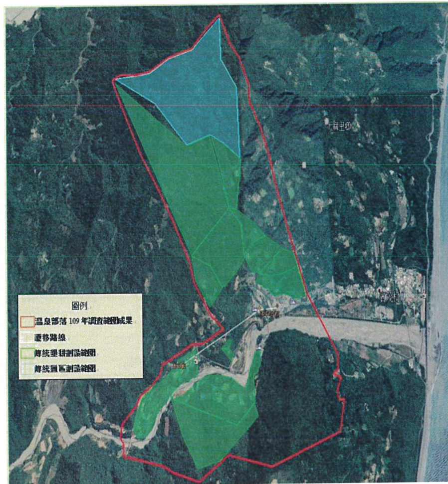
圖8 溫泉(Padrangirangi)部落傳統領域劃設成果圖

於109年10月6日至10月8日進行傳統領域現勘，現勘調查完畢後，透過地理資訊系統(GIS)將GPS定位系統紀錄坐標點位(經緯度)，轉換為Google地球可顯示之數位檔案(.kml檔)，定位結果與部落傳統領域土地範圍不盡相符。於12月14日小組討論後，確認其調查成果與部落傳統領域範圍相符，其劃設成果如下圖8，同時彙整傳統地名資料如下表4。