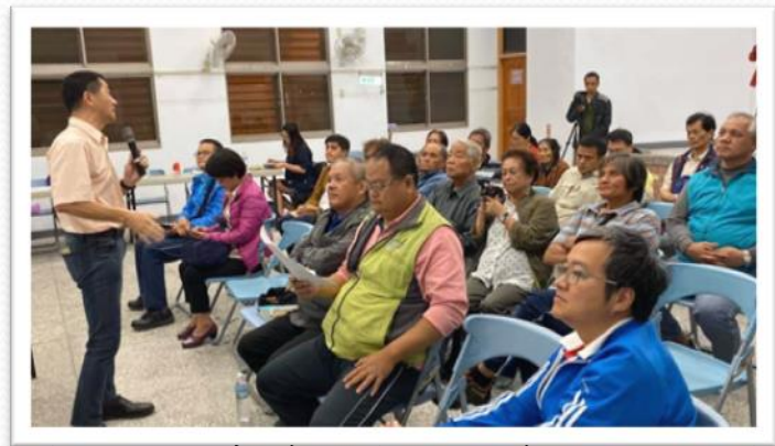
委託國立東華大學至部落召開說明會