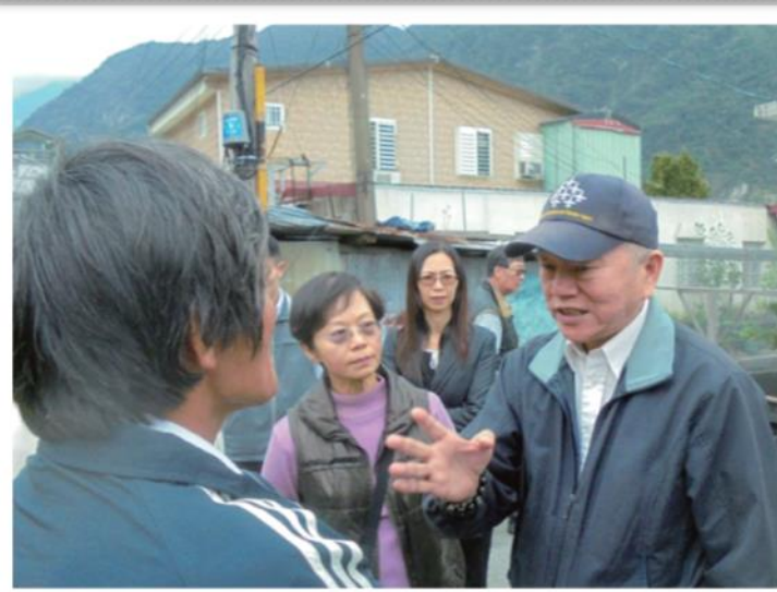
沈副院長時任經濟部長，至部落現勘參加會議