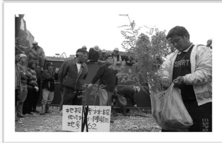
族人進入亞泥廠區種下樹苗，象徵性行使耕作權