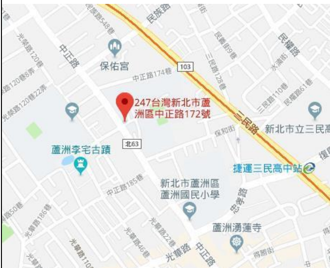
國立空中大學位置圖