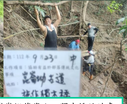
協助望嘉部落整理祖靈屋

去年有提報喜樂發發公園崑崙坳修復人工獨木橋的計畫今年針對這項目，隊員們總共搭建了4做人工獨木橋。