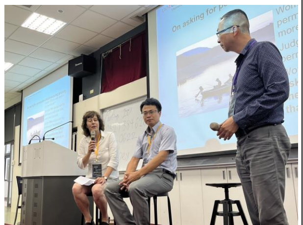
挪威學者與臺灣產學界之水產研究者研討地方智慧在產業的應用及學術價值。