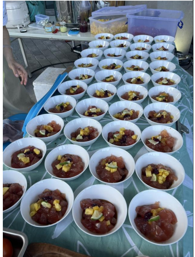
結合多元族群文化之大會慢食餐點。