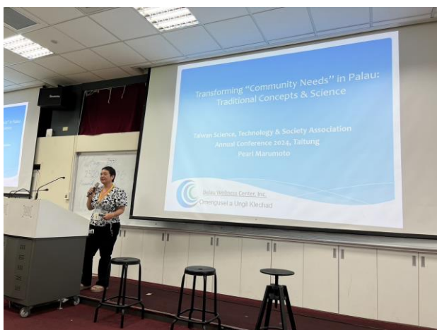
帛琉學者分享其在帛琉長期推動的社區健康工作。