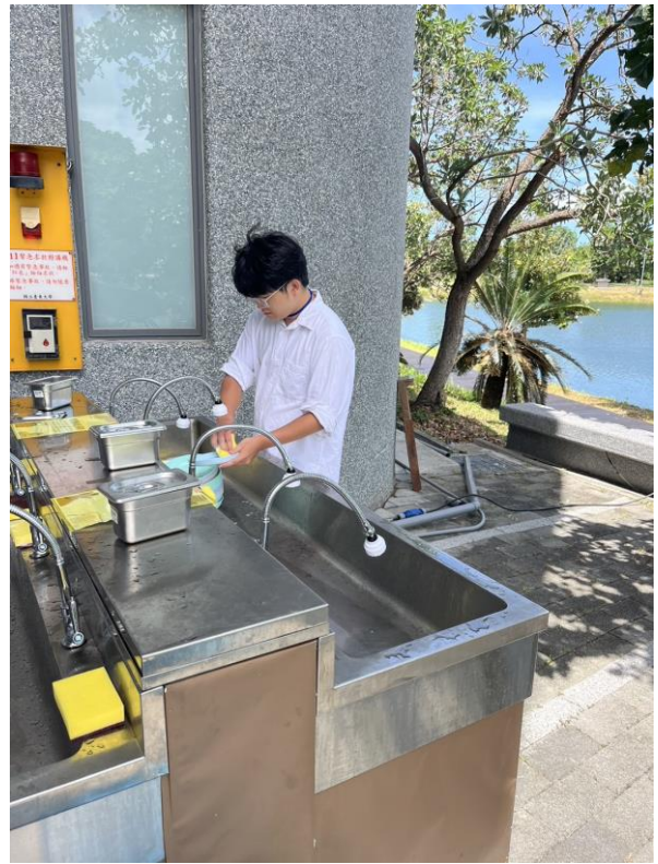
大會提供臺東慢食節使用的油水分離洗手台，鼓勵與會者使用並減免使用一次性餐具，共同愛護臺東的美好環境。