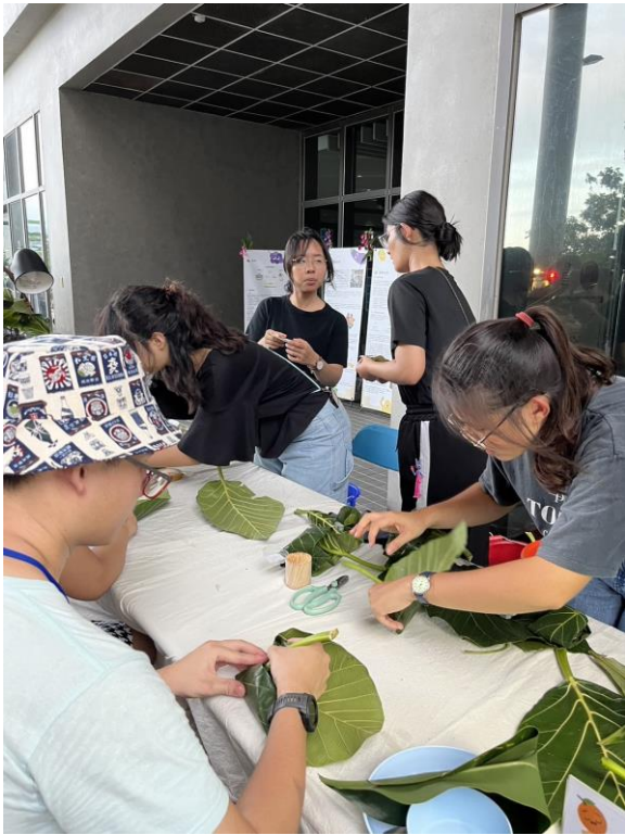
臺東大學文化資源與休閒產業學系學生先向在地居民學習自然食器製作，再跟與會者分享做法，與會者享用餐點時，得以使用自然食器並減廢。