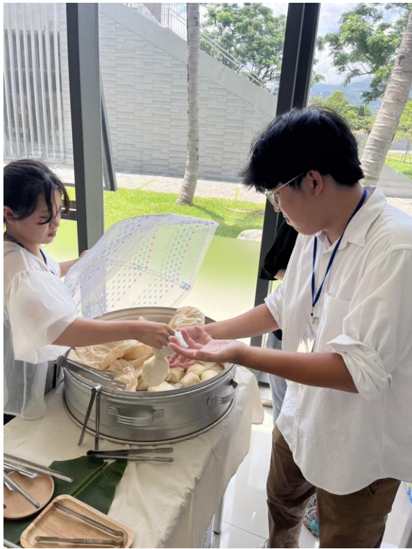
大會工作人員協助提供原住民健康美食予與會者。