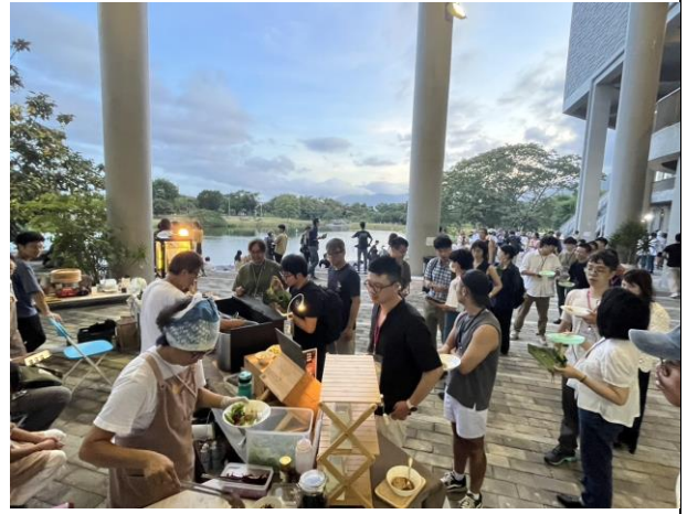
大會以多元飲食文化為題，讓與會者體驗臺東不同之料理及交流方式。