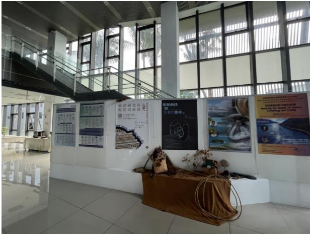
大會會場內佈置以原住民傳統生態智慧為題，展示自然編織、植物使用等內涵。