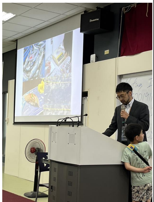
日本學者（與其小孩）一起分享最前沿之飲食文化研究，在親子友善的環境下讓與會投入反思多元族群文化下，貿易、食物及社會發展的多種可能性。