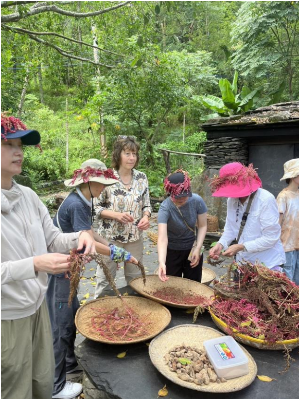
國際及臺灣學者一邊學習原住民紅藜收成處理方式，一邊進行交流。