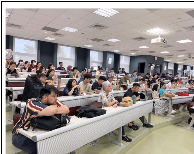
與會者專心聆聽大會主題演講及論壇。