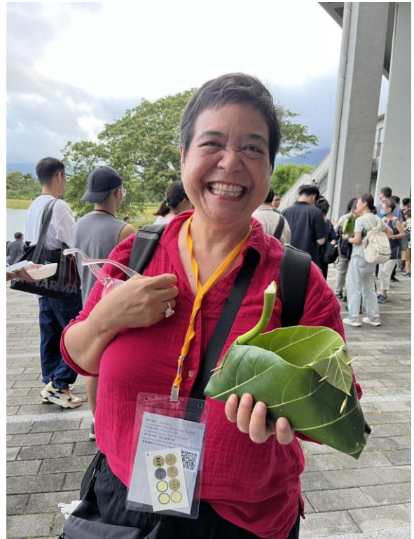
來自帛琉的演講嘉賓使用自然食器來享用大會安排之餐點。