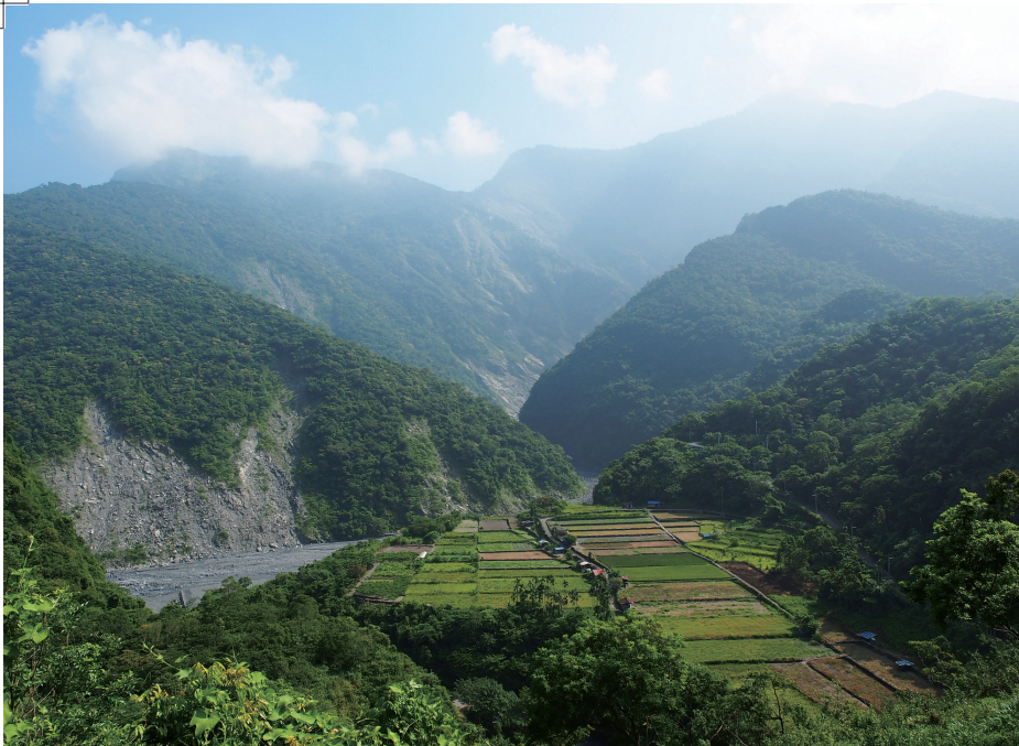
山谷的水田，左為溫泉溪（野溪溫泉）