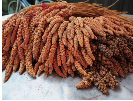
小米酒的主要原料—小米