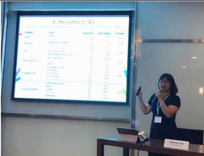
認真英文口頭報告