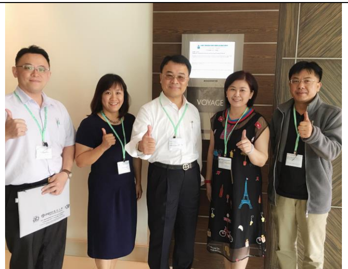
順利完成任務滿載而歸