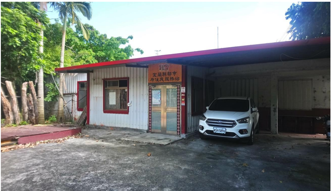
「原住民族多功能會館」基地所在位置過去曾為宜蘭縣都市原住民服務站。