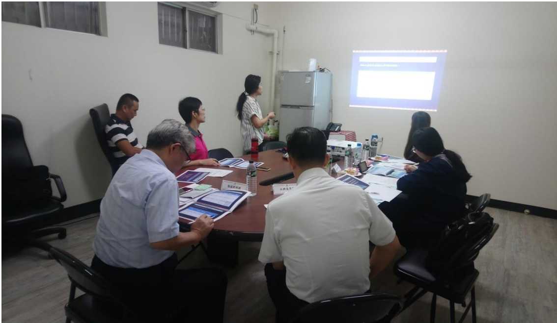
宜蘭縣原住民事務所針對「原住民族部落文化綜合服務據點友善空間整建計畫案」執行情況進行簡報。