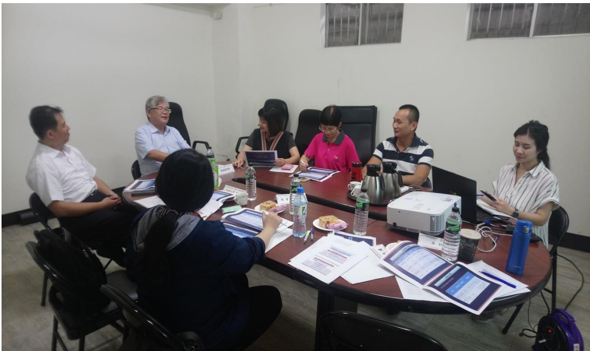
針對「原住民族部落文化綜合服務據點友善空間整建計畫案」困難點進行討論，徐技監明淵對後續執行指示改善方向及對策。